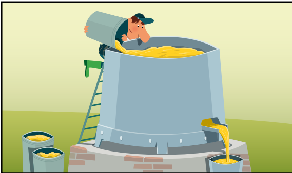
L'extraction du jus (le pressoir)

À toi de jouer ! Remets dans l'ordre les étapes en numérotant les vignettes.