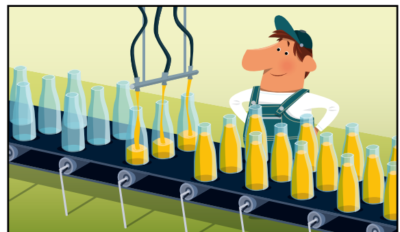
La mise en bouteilles