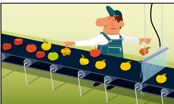
Le lavage et le tri des pommes